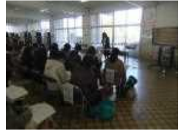
新入生の保護者説明会

2月3日(火)に、新1年生の保護者のみなさんにお集まりいただき、新入生説明会を行いました。来年度入学予定の新1年生は、49名です。長尾小学校の概要を知っていただくことと、1年生に入学したときに必要になる持ち物について、実物をお見せしながら、準備の方をお願いしました。教材や教具の全てに名前を書くをお願いしましたが、それだけでも結構な数があるので大変かと思います。一つ一つにお子さんの名前を書くことにより、あらためて入学することを実感できるのではないかと思います。約半数の方が、上のお子さんがないので初めて小学校に入学させる保護者のみなさんでした。大きな不安と期待を込めて入学してくるわけですので、私たちもそれに真摯に向き合い今後の教育に努めて参りたいと思います。何かご不明なところがありましたら、いつでも学校の方に問い合わせください。