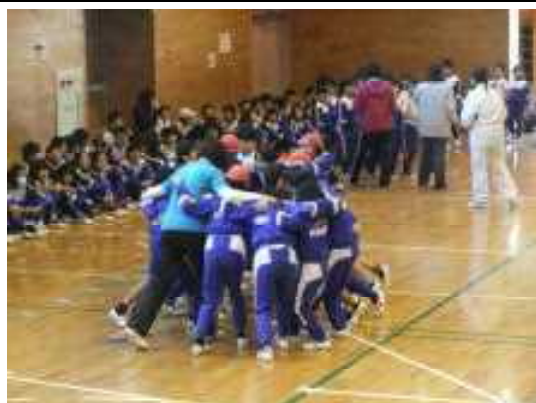
気合いが入る3年生

2月4日(水)に朝行事の時間を利用して、校内の縄跳び大会を行いました。縄跳び大会に向けてどの学年も中休みや昼休みを使い取り組みました。そしてその成果を十分に発揮できたクラスが多かったように思います。特に、高学年の部で優勝した6年2組は、引っかかることが少なかったため、5分間で600回を超える素晴らしい記録を出すことができました。県の縄跳び大会(11日)、市の縄跳び大会(21日)もありました。個人として、体育部として、クラスとして、いろいろな出場形態でしたが、自己ベストが大会で出せるよう頑張っていました。