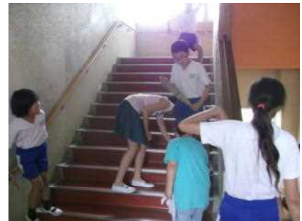
縦割り清掃の様子

70日間の1学期が今日で終わりになります。1年生にとっては、期待と不安でスタートした小学校生活にも慣れ、楽しんで生活できているように思います。今年度のはじめに「もっと笑顔あふれる長尾小にしよう」ということを合言葉に、6年生を中心に、縦割り清掃や縦割りの遊び集会等を取り入れてきました。上級生がリーダーシップを発揮してくれてうまくいっている部分ともう少し改善した方がいい部分とが混在しているように思います。チャレンジしたからこそ見えてきたことであると思います。よかったところは更に伸ばし、改善すべきところは修正し、更に高みを目指してほしいと思います。通知票には個々のよかったところ、改善すべきところが記載されています。休み中に自分はこれを頑張ろうということを決め、実行してほしいと思います。夏休みが明けたとき更にたくましくなったみなさんに会えることを楽しみにしています。